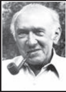
F. Filipovský (†86)