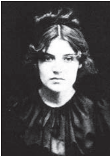
Suzanne Valadon (1865 -1938)