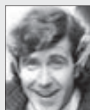
JIŘÍ HRZÁN herec

• Max Švabinský *17. 9. 1873 Kroměříž †10. 2. 1962 Praha Malíř a rytec. Čestný profesor akademie výtvarných umění.