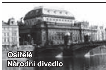
Osirelé Národní divadlo

Národní - To byl tedy fofr! Padák na hodinu je pro ředitele divadla totéž, jako když se pod Hamletem