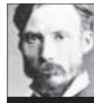
Auguste Renoir MILENEC