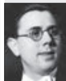
JAROSLAV JEŽEK skladatel