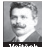
Vojtěch Hynais MALÍŘ