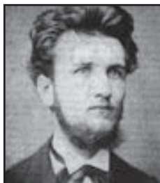
František Filipovský Táta, kapelník

Filipovský je s Oldřichem Velenem zřejmě nejobsažovanější český herec. Hrál přes 300 rolí.