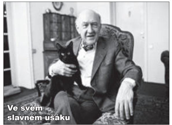
Ve svém slavném ušáku

potřeboval mít vedle sebe své blízké a okolo milované psi a kočky. Uměl a dokázal žít i beze slov. František Filipovský zemřel 26. října roku 1993 v Praze.