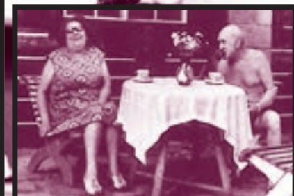
S manželkou a dýmkou na chatě v Poříčí nad Sázavou