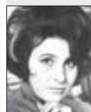
JUDITA ČEŘOVSKÁ zpěvačka