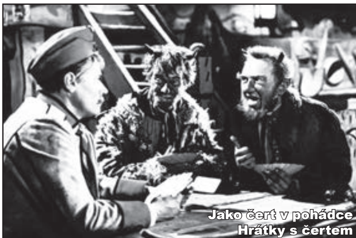
Jako čert v pohádce Hrátky s čertem

(*1971) Dcera Pavlíny Filipovské a Petra Spáleného. Je novinářkou.