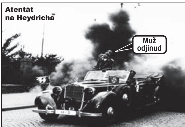
Atentát na Heydricha