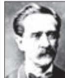
KAREL SABINA Revolucionář