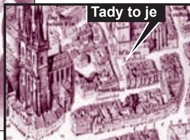
Tady to je

Tenhle slavný podnik vznikl v roce 1919. Chapeau Rouge byl neveliký: vešlo se tam sotva dvacet stolů. Mezi stálé hosty patřilo asi patnáct dívek. Prohlašovaly, že jsou z Francie, Belgie, z Německa, ze Švédska či Finska. Za lokálem byly malé komůrky. Podle policejního nařízení nesměly být zamčené, tak u nich hlídkoval sluha.