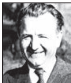
Klement Gottwald Prezident

(1933 - 1984) Hrál Ziku ve filmu Klíč. O 13 let později se oběsil v koupelně.