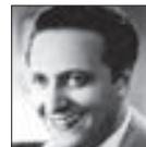
Hugo Haas KAMARÁD