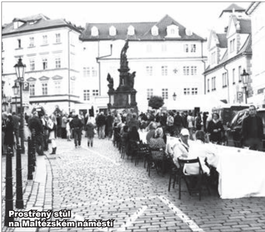
Prostřený stůl na Maltézském náměstí

Charitativní projekt pro rozvoj občanské společnosti za podpory Malostranských novin a Staroměstských novin. Web: www.kampanula.cz