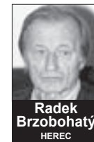
Radek Brzobohatý HEREC