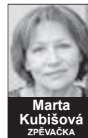
Marta Kubišová ZPĚVAČKA