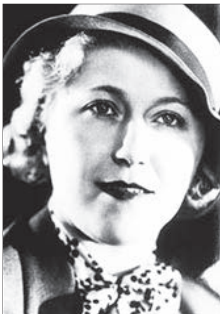
Olga Scheinpflugová (1902 -1968)

Olga Scheinpflugová Herecká hvězda Národního divadla