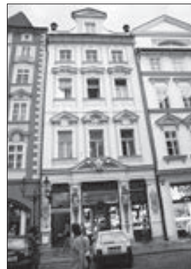
Dům U Zlaté koruny dnes

slerových, kde se ukrýval, a na následky svého zranění zemřel 15. června v pankrácké věznici. Je po něm pojmenována ulice v Praze -Dejvicích.