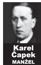
Karel Čapek MANŽEL