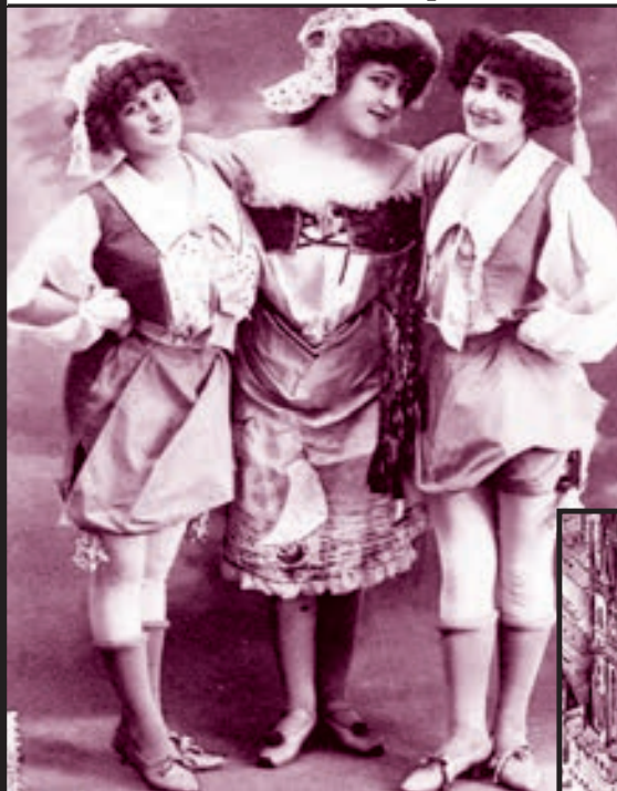
BYLY mladé, veselé a uměly tancovat.

Tenhle slavný podnik vznikl v roce 1919. Chapeau Rouge byl neveliký: vešlo se tam sotva dvacet stolů. Mezi stálé hosty patřilo asi patnáct dívek. Prohlašovaly, že jsou z Francie, Belgie, z Německa, ze Švédska či Finska. Za lokálem byly malé komůrky. Podle policejního nařízení nesměly být zamčené, tak u nich hlídkoval sluha.