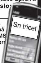
Praktický ATS, informace 776989 198, www.prenumerace.cz