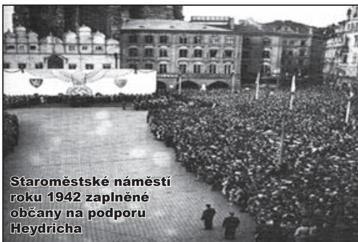
Staroměstské náměstí roku 1942 zaplněné občany na podporu Heydricha

(1885 - 1949) Hrob majitele lékárny U Zlaté koruny. Schöbling vyráběl i zubní pasty.