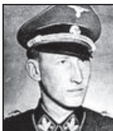
Reinhard Heydrich Nacista

(1904 - 1942) Zastupující říšský protektor Protektorátu Čechy a Morava.