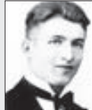
JAN OPLETAL Hrdina