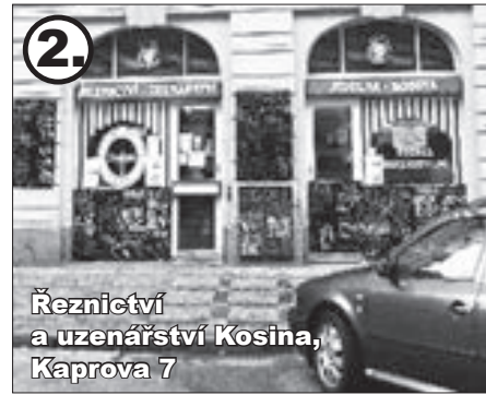
Řeznictví a uzenářství Kosina, Kaprova 7