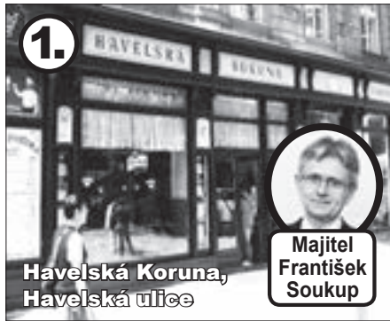
Havelská Koruna, Havelská ulice