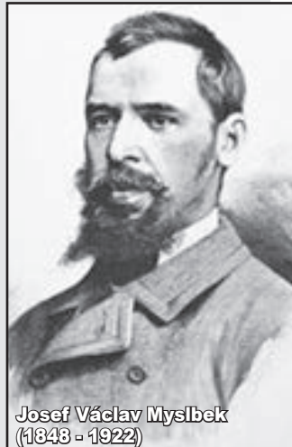
Josef Václav Myslbek (1843 - 1922)