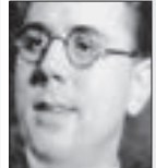
Jaroslav Ježek skladatel