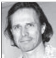
Janek Ledecký ZPĚVÁK