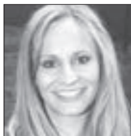
Monika Absolonová ZPĚVAČKA