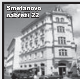
Smetanovo nábřeží 22

sv. Václava na Václavském náměstí. Je také autorem slavného pomníku K. H. Máchy na Petříně.