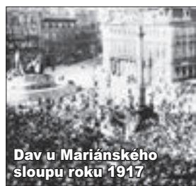
Dav u Mariánského sloupu roku 1917