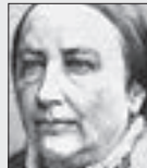
Sofie Podlipská spisovatelka

• Sofie Podlipská *15. 5. 1833 Praha †17. 12. 1897 Praha Spisovatelka a překladatelka, mladší sestra Karoliny Světlé. Velice mrštná v ženských spolicích.