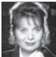
Libuše Šafránková HEREČKA

Zprávy a tipy do této rubriky pište na adresu redakce@staromestskenoviny.eu , nebo tel.: 777 556 578