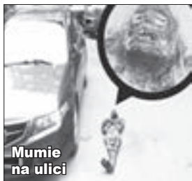
Mumie na ulici

Červen - Vyděsila spoustu lidí! Chodci upozornili policii, že na ulici leží vedle zaparkovaných aut mumie. Policisté zjistili, že jde o atrapu. Zřejmě to byla recese, což je fajn.