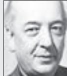
Josef Skupa loutkář