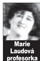
Marie Laudová profesorka

Byla nejen vynikající herečka, ale i pedagožka na DAMU. V letech 1941 - 77 byla členkou činohry ND. Prožila harmonické manželství s hercem Bohušem Záhorským. Bydleli hned vedle Národního divadla. Do jejich bytu chodilo na návštěvu mnoho kolegů a žáků. Hrála např. ve filmu Prstýnek (1944) nebo Srpnová neděle (1960).