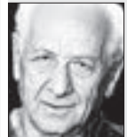
Arnošt Lustig spisovatel