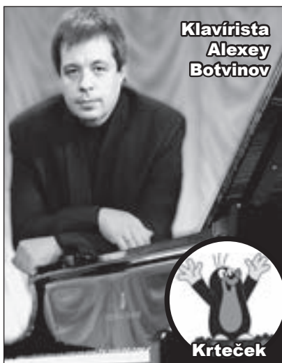
Klavírista Alexey Botvinov

Geniální umělec představí své umění v mystickém kostele sv. Tomáše