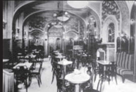
Národní kavárna v roce 1923

Kavárna byla obnovena v roce 2007 a v roce 2013 byla kompletně zrekonstruována do nynější podoby včetně zrestaurování dobových štuků.