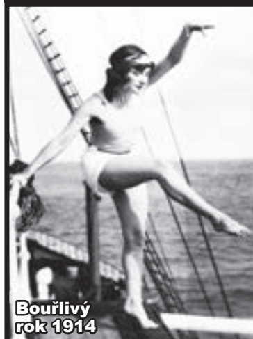
Bouřlivý rok 1914