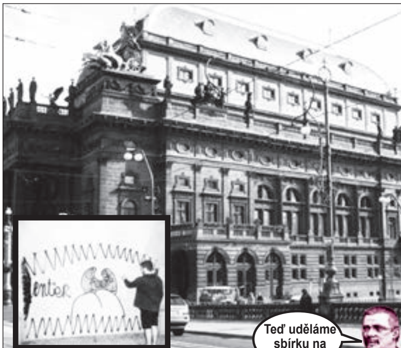
Když Francouz, tak při činu

Při sbírce na Národní divadlo uspořádaly vlastenky na Žofíně bazar.