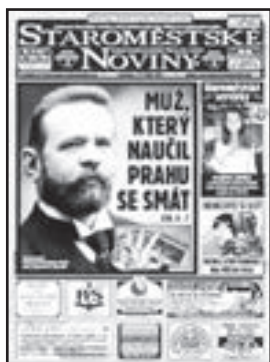
Staroměstské noviny č. 8, srpen 2014