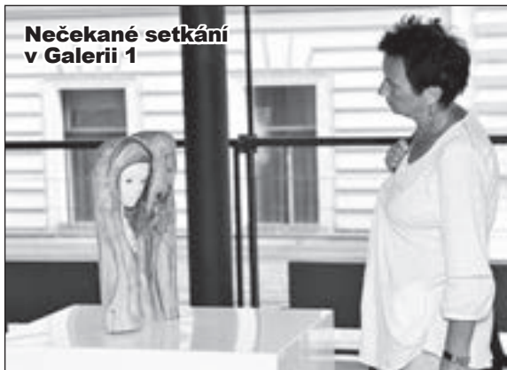
Nečekané setkání v Galerii 1

Již pošestnácté se uskuteční výstava Budoucnost a přítomnost Prahy 1 , která každoročně přibližuje projekty na území první městské části. Lidé se také budou moci v anketě vyjádřit k využití Werichovy vily.