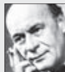
Bohuš Záhorský HEREC