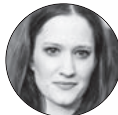
Natálie Kocábová Zpěvačka