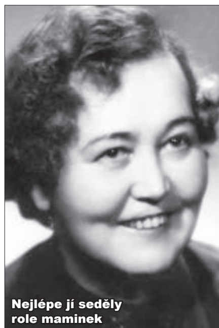
Nejlépe jí seděly role maminek