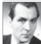
Gustav Nezval HEREC