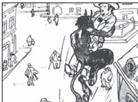
Čert: „Volal jsi mě, proto ti pomohu, ale upíšeš se mi svou duší!“