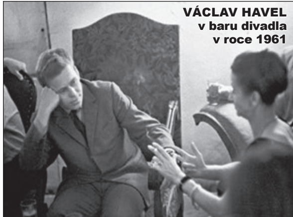
VÁCLAV HAVEL v baru divadla v roce 1961

Proč 150? Oprava divadla potrvá 150 dní. Do té doby bude soubor hostovat ve Švandově divadle na Smíchově. Radní Jan Wolf uvolnil na opravu Divadla Na zábradlí 40 milionů Kč.