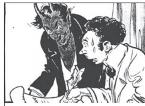
Hříšník: „Podepíšu, ale vykonáš tři úlohy, které ti poručím.“ Čert: „Platí!“