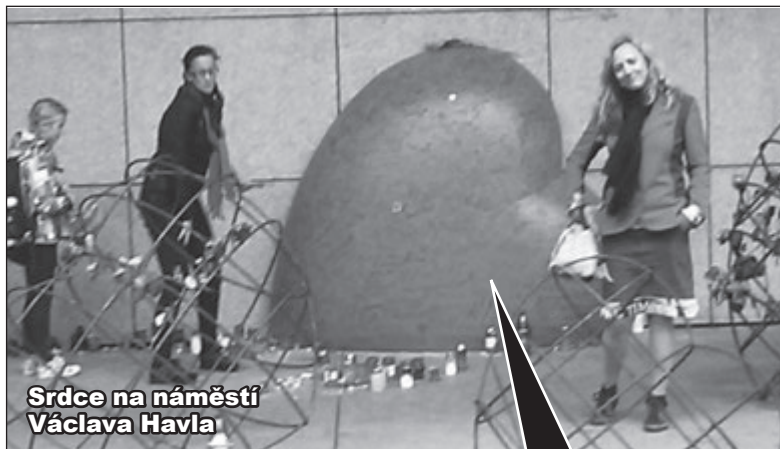
Srdce na náměstí Václava Havla

Dobrou zprávou by pro něj byla i začínající rekonstrukce Divadla Na zábradlí, kde začínal (viz str. 6).