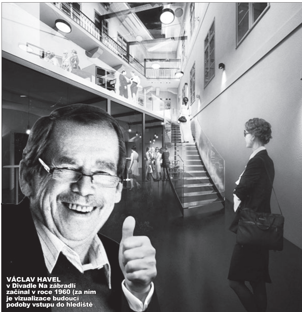
VÁCLAV HAVEL v Divadle Na zábradlí začínal v roce 1960 (za ním je vizualizace budoucí podoby vstupu do hlediště)

Foto: Archiv, žertovná koláž Ondřej Höppner