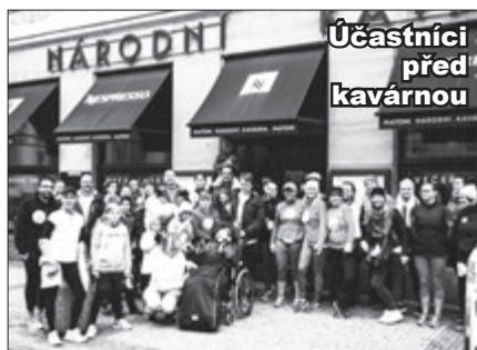
Účastníci před kavárnou