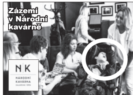
Zázemí v Národní kavárně