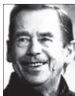
VÁCLAV HAVEL 1. prezident ČR