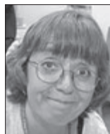
Barbora Hrzánová, herečka