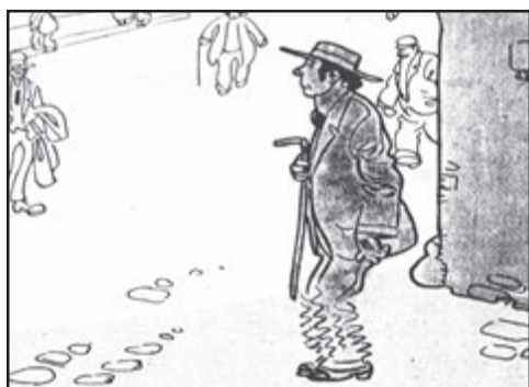
Hříšník: „A jsem v tom až po uši. Dlužím, kam se podívám. Čert aby to vzal!“

Staroměstské noviny k počtě Humoristickým listům (1916)