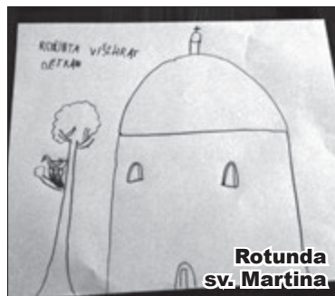
Rotunda sv. Martina