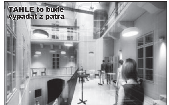
TAHLE to bude vypadat z patra

Jak se říká: Vlk (majitel Pachtova paláce) se nažral (hotel) a koza zůstala celá (divadlo žije) - ba co víc! Vstup přes dvoranu umožní autorům vtáhnout diváka do děje dřív, než zasedne do svého měkkého sedadla.