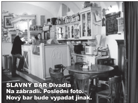
SLAVNÝ BAR Divadla Na zábradlí. Poslední foto. Nový bar bude vypadat jinak.

No vida! A to to jednu chvíli vypadlo, že nejslavnější malou scénu v Praze zavřou. Nyní už je jasné, že Divadlo Na zábradlí bude nejen pokračovat na své adrese, ale ještě bude krásnější.