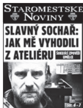
Staroměstské noviny ZÁŘÍ 2016