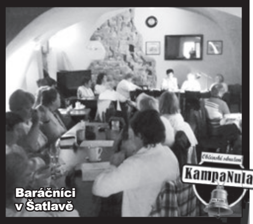
Baráčníci v Šatlavě

Saská - Všebaráčnická rychta je v opravě, tak naši baráčníci náhradní prostor v Šatlavě v Saské ulici. Scházejí se tu jak jednotlivé župy, tak baráčníci z celé republiky.