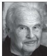
Luděk Munzar, herec