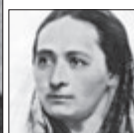
Božena Němcová, kamarádka

Karolina Světlá (1830 - 1899) se narodila na Starém Městě, kde prožila i své mládí. Byla vychovávána v bohaté pražské měšťanské rodině, kde se mluvilo převážně německy. Vdala se za svého