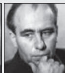
Otomar Krejča REŽISÉR