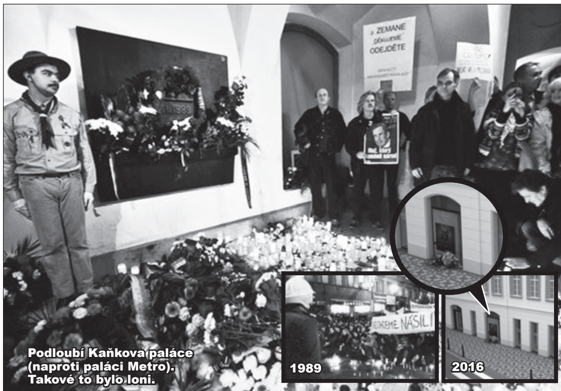
Podlouhí Kaňkova paláce (naproti paláci Metro). Takové to bylo loni.