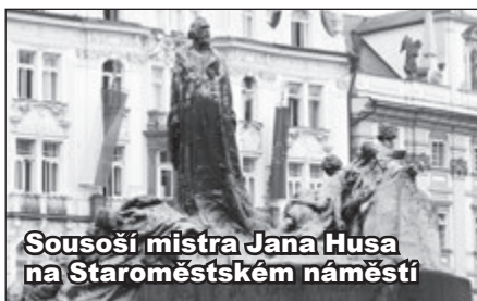
Sousoší mistra Jana Husa na Staroměstském náměstí

Pořád hučí! Na redakci Staroměstských novin se obrátilo několik čtenářů se svým svědectvím.