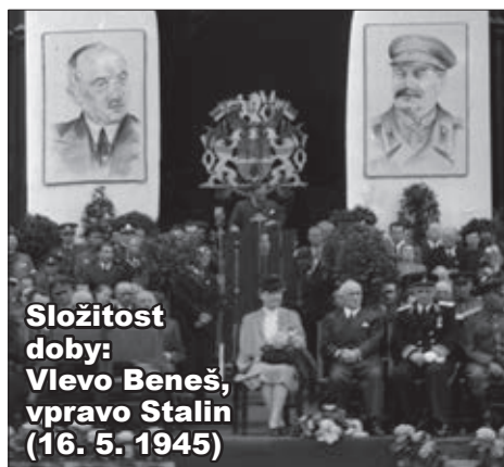
Složitost doby: Vlevo Beneš, vpravo Stalin (16. 5. 1945)