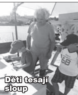
Děti tesají sloup