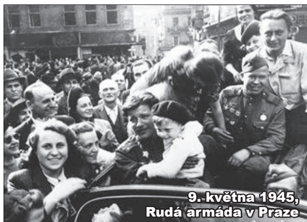
9. května 1945, Rudá armáda v Praze

POZOR NA PŘEPISOVÁNÍ HISTORIE STAROMĚSTSKÉ NOVINY