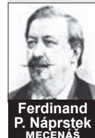
Ferdinand P. Náprstek MECENÁŠ