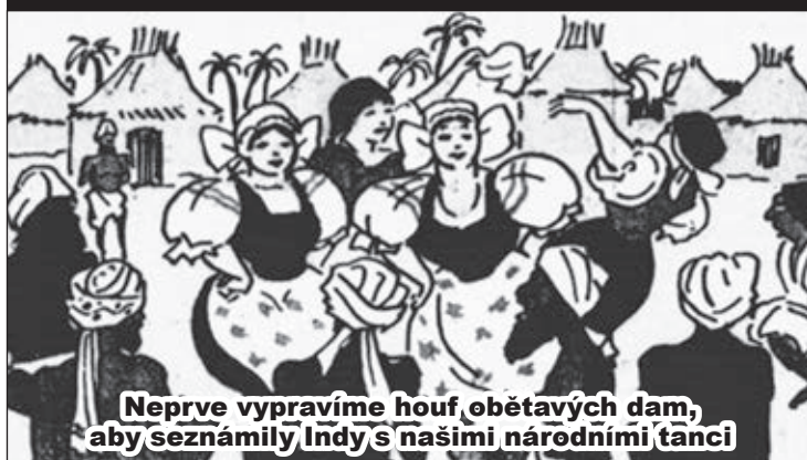
Neprve vypravíme houf obětavých dam, aby seznámily Indý s našimi národními tanci

Staroměstské noviny k počtě Humoristickým listům (1919)