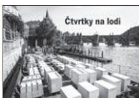
Čtvrtky na lodi

Staré Město - Magistrát se sice zdráhá povolit zábor prostranství pro návrat Mariánského sloupu na Staroměstské náměstí, práce na sloupu však pokračují na lodi pod Karlovým mostem na Alšově nábřeží. Můžete se přijít podívat každý čtvrtek od 10 do 19 hodin. Od 19 hodin je přednáška, nebo