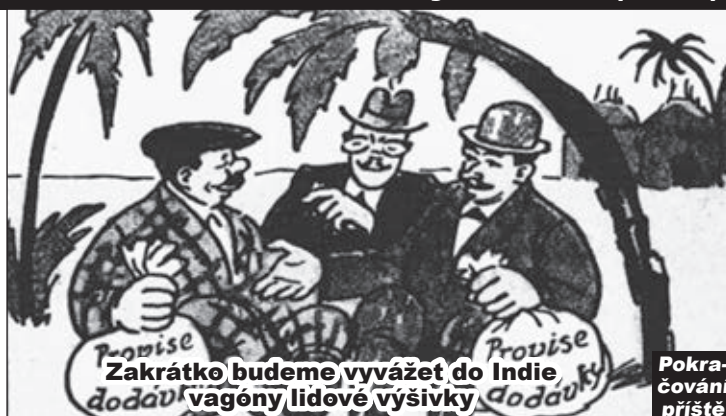
Zakrátka budeme vyvážet do Indie dodav' vagóny lidové výšivky.