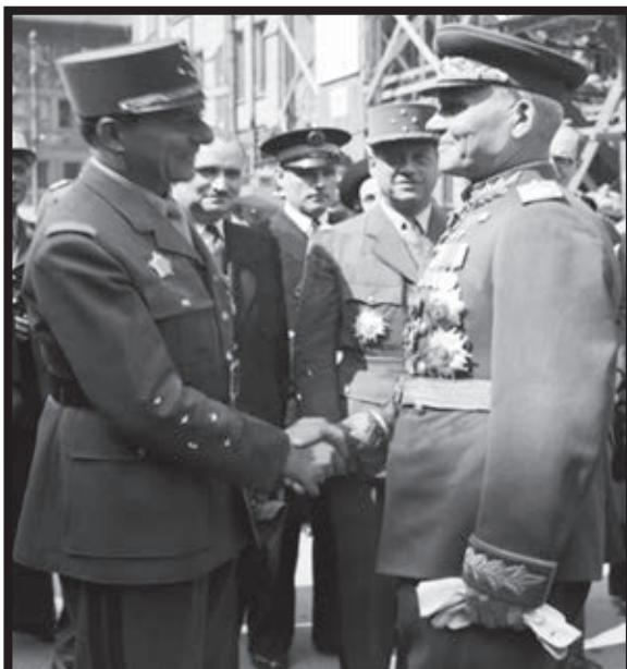
Francouzský generál Jean de TASSIGNY a maršál Koněv si potřásají rukou před Staroměstskou radnicí při odhalování desky Osvobození (8. 5. 1946).