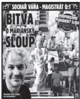
Staroměstské noviny, minulé číslo