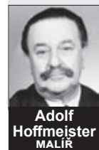
Adolf Hoffmeister MALÍŘ