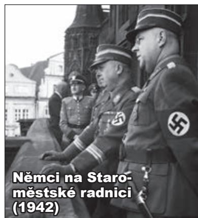
Němci na Staroměstské radnici (1942)