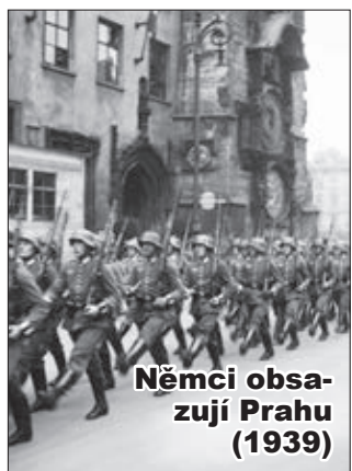
Němci obsazují Prahu (1939)