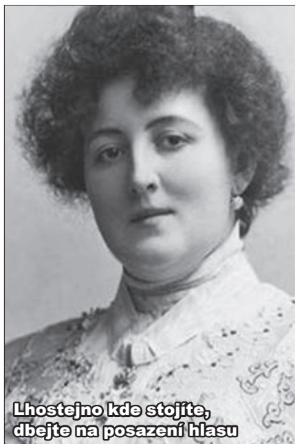
Lhostejno kde stojíte, dbejte na posazení hlasu