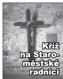
Kříž na Staroměstské radnici