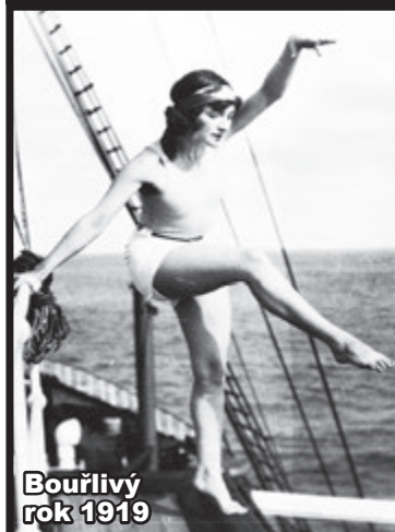
Bouřlivý rok 1919