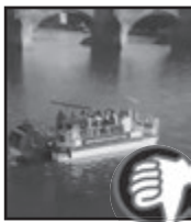
ŠLAPACÍ ALKOLODĚ NA VLTAVĚ

Šance na vrácení desky na Staroměstskou radnici stouply poté, co si starosta Praha 6 uřízl ostudu.