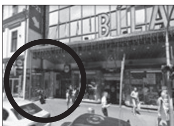
Dva strážníci zaparkovali kola v koutě u Bílé labutě...