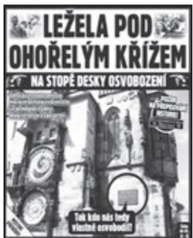
Staroměstské noviny, minulé číslo