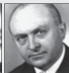
Otakar Vávra REŽISÉR

• Václav K. Klicpera *23. 11. 1792 Chlumec nad Cidlinou †15. 9. 1859 Praha Dramatik, Stavovské divadlo.