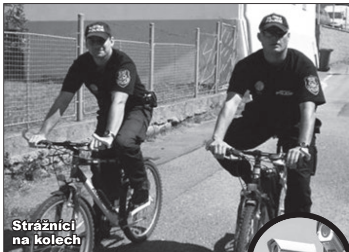
Strážníci na kolech

V centru Prahy je každý rok ukradeno asi 100 kol.