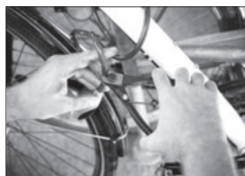
Zloděj kleštěmi přecvakl bezpečnostní lanko a bylo to...