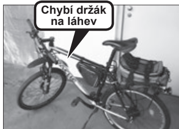
Chybí držák na láhev