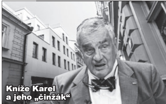
Kníže Karel a jeho „činžák“

Ostrovni - Podnikatel Karel Schwarzenberg nabízí byty ve svém nově postaveném komplexu.