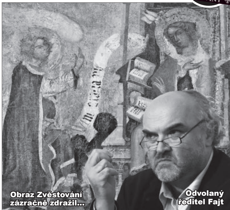
Obraz Zvěstování Panně Marii zázračně zdrazil...