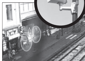
Jeden poberta hlídal, druhý vytáhl z batohu kleště...