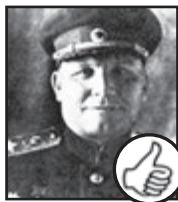
MARŠÁL KONĚV (Osvoboditel Prahy 1945)

Šance na vrácení desky na Staroměstskou radnici stouply poté, co si starosta Praha 6 uřízl ostudu.