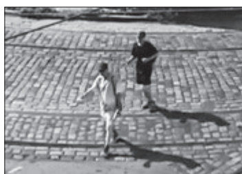
Zatímco si kupovali pití, zamířili k labutě tito dva hoši...