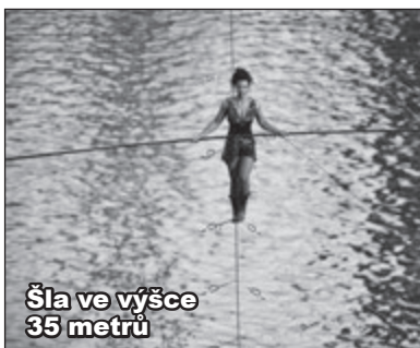
Šla ve výšce 35 metrů