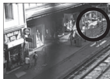
Mladíci odjíždějí na kolech, ukradených strážníkům.