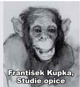
František Kupka, Studie opice