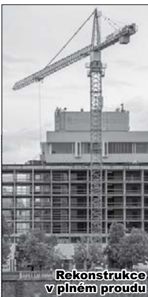
Rekonstrukce v plném proudu

Po bitvě o javor se v Praze 1 rozhořel další zvláštní konflikt. Tentokrát jde o rekonstrukci hotelu InterContinental. Ze známého a vyhlášeného hotelu totiž dělníci odstraňují 35 tun azbestocementových panelů jako by se nechumelilo. Žádné speciální opláštění a další opatření, která by se dala v případě vysoce karcinogenního materiálu očekávat, se nekonají. A majitelům hotelu zjevně ani nevádí, že hned vedle stojí Základní škola nám. Curieových . Zakrytí hotelu by je totiž vyšlo na rozhodně nemalé peníze a to si žádní miliardáři jako oni přeci nemohou dovolit. Sami dělníci Metrosta-