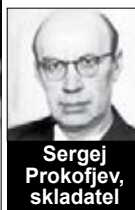
Sergej Prokofjev, skladatel

Do dějin baletu se zapsala jako první Julie Prokofjevova baletu Romeo a Julie. V Národním divadle působila od roku 1943 do roku 1959. Vychovala řadu osobností českého baletu (Jiřího Kyliána, Pavla