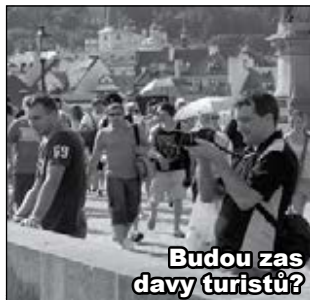
Budou zas davy turistů?

Kromě vln pandemických jsme v ohrožení vln turistických. Mnoho z našich sousedů, z obavy o noční klid a pořádek na ulicích, očekávají s obavami čas, kdy se zase zaplní naše ulice, tedy především naše chodníky. Ještě si pamatujeme, jaké překážky tvořily zelené koloběžky, zaparkované kdekoliv, válející se také kdekoliv. Jak to tak vy-