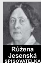
Růžena Jesenská SPISOVATELKA