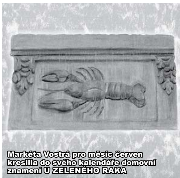
Markéta Vostrá pro měsíc červen kreslila do svého kalendáře domovní znamení U ZELENÉHO RAKA

vost, strach, který je všude tam, kde chybí láska. V tomto čase si můžeme více uvědomovat, jak důležité je nezabývat se minulostí, tím se uvolní značné množství energie, kterou lze věnovat přítomným dějům. Esencí tohoto času je rozlišení mezi trvalostí a stálostí citu a rychle se měnícími pocity.