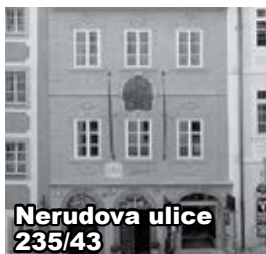
Nerudova ulice 235/43

Více než kdy jindy je akcentováno téma domova, rodiny a jejich příslušníků. Tento čas nás vede k uvědomování si toho, že nejblíže a bezprostřední domov je naše vlastní tělo. Tak, jak se cítíme, takový máme život a jeho situace pouze kopírují naše naladění. Odvrácenou stranou tohoto znamení je ulpívání, neschopnost čelit zpřímá nastalým situacím, přestrosí politika, uhýba-