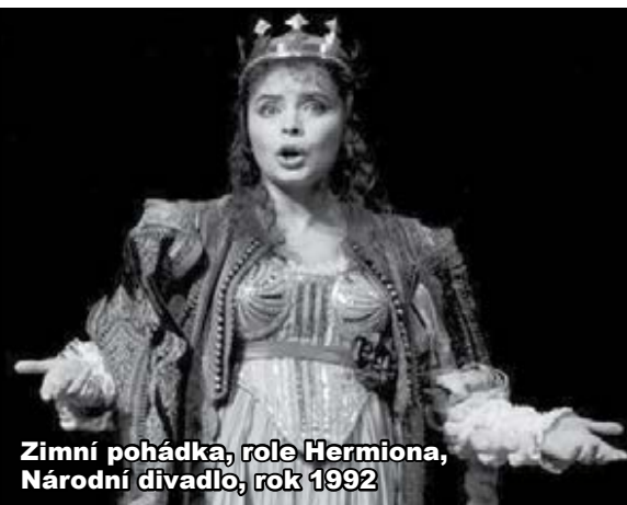
Zimní pohádka, role Hermiona, Národní divadlo, rok 1992