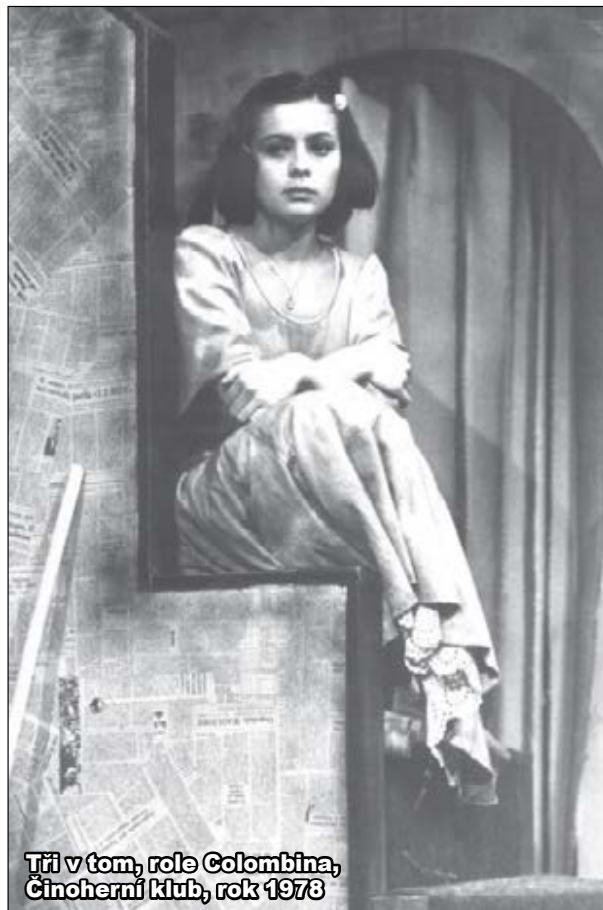
Tři v tom, role Colombina, Činoherní klub, rok 1978

„Já k tomu tématu, když někdo odejde, nerada mluvím, protože sama jsem se dožila pozeňného věku. A když mám mluvit o mladších, kteří odcházejí, mluví se mi těžko... Bude to naše věčná, krásná princezna.“