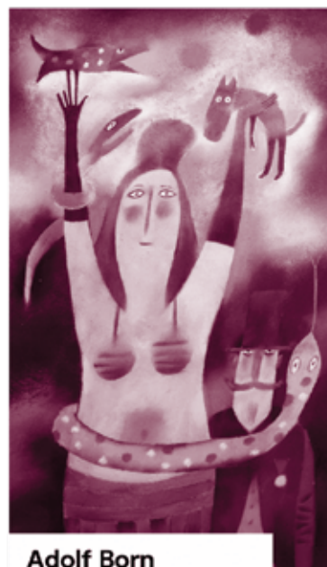
Adolf Born Úspěšné cirkusové vystoupení