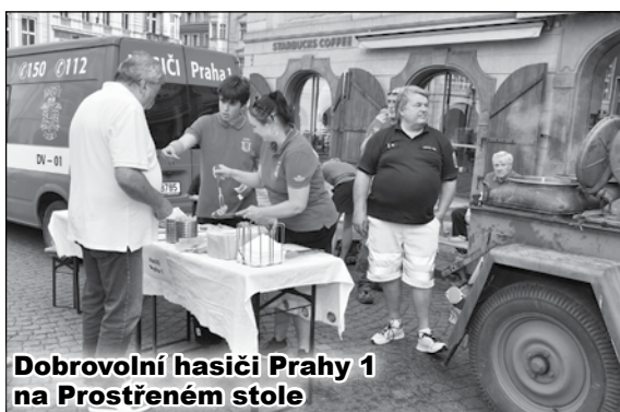
Dobrovolní hasiči Prahy 1 na Prostřeném stole