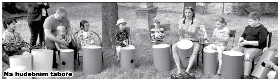
Na hudebním táboře