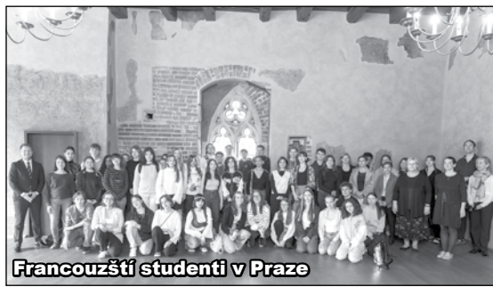
Francouzští studenti v Praze

Tipy na oblíbené spolky pište na: redakce@staromestskenoviny.eu