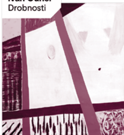
Ivan Ouhel Drobnosti

Pokud máte nějaký zajímavý obraz, kresbu, grafiku, sochu, mince či jiný umělecký artefakt, budeme rádi, když nám ho nabídnete.