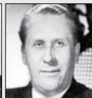
Václav Havel STAVITEL