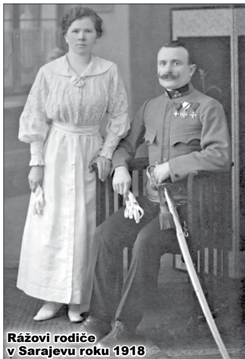
Rážovi rodiče v Sarajevu roku 1918