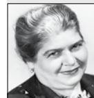
Antonie Nedošinská HEREČKA