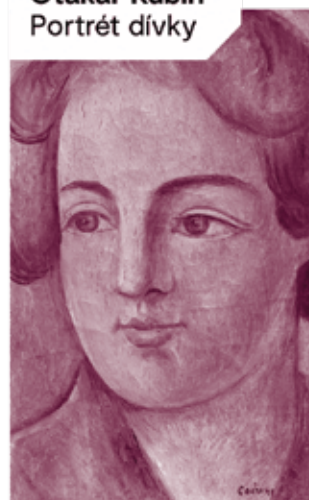
Otakar Kubín Portrét dívky

VYBÍRÁME Z AUKCE ZÁŘÍ. UKONČENÍ AUKCE 5. - 7. 9. 2023