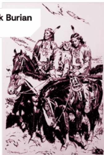
Zdeněk Burian Indiáni

VYBÍRÁME Z AUKCE ZÁŘÍ. UKONČENÍ AUKCE 5. - 7. 9. 2023