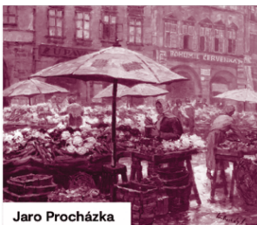
Jaro Procházka Havelské tržiště