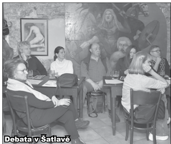
Debaty v Šatlavě

Výbor Klubu poslal žádost o zrušení tohoto rozhodnutí a ponechání možnosti pokračovat Klubu v činnosti bez hudby, jako pouze pro