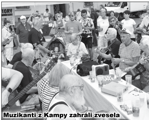
Muzikanti z Kamy zahráli zvesela

KampaNula spolupřádá (vše na str 8. MN + SN + na fb): Učené toulky Petřínem, Prostřené stoly, večery hudební, výlety s TURAS do přírody, také Toulky v sedě v klubu Šatlava... A kdo chce vědět více, čte noviny a dozví se... Díky za pozornost. Sepsal Jiří Kučera