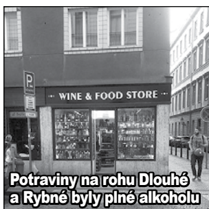
Potraviny na rohu Dlouhé a Rybné byly plné alkoholu

Na Malé Straně je to s občanskou vybaveností vůbec bída, a tak pro pečivo a potraviny chodím na Staré Město. Proto mě zarazilo, že někdo může vážně uvažovat o tom, že by oblíbená Jizerská pekárna v nebytovém prostoru Prahy 1 na rohu Dlouhé a Dušní měla být nahrazena bageterií nebo nějakým jiným podnikem pro turisty. Už před deseti lety se konala petice za zachování tohoto obchodu a jsem jediné ráda, že tentokrát to