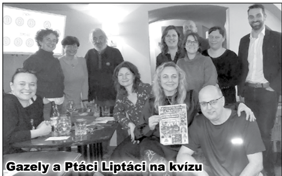
Gazely a Ptáci Liptáci na kvízu