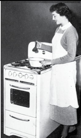
VAŘENÍ na plynu inzerce

na zmrzlinu, kovové mříže kolem stromů. Též finančně podporoval stavbu Petřínské rozhledny a lanovky, stál u zrodu Sokola, Klubu českých turistů (značení stezek), České společnosti zeměvědné. V Americe zkoumal indiánské kmeny.