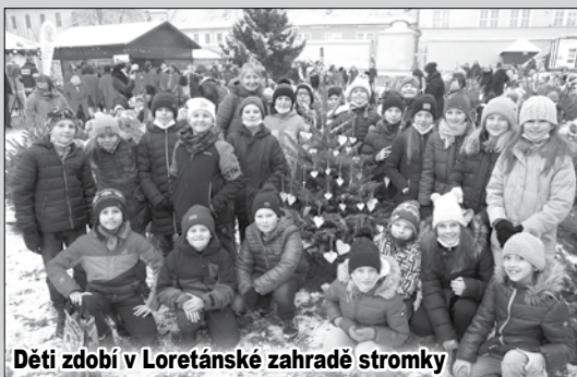
Děti zdobí v Loretánské zahradě stromky