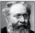
Jan Neruda, ctitel