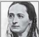
Božena Němcová, kamarádka

Karolina Světlá (1830 - 1899) se narodila na Starém Městě, kde prožila i své mládí. Byla vychovávána v bohaté pražské měšťanské rodině, kde se mluvilo převážně německy. Vdala se za svého