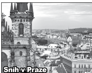
Sněh v Praze

Nenapsat o vzácném hostu, co nás letos navštívil, je stejný hřích jako nenapsat, kdyby nás navštívil papež František. Oba mají jedno společné, objevují se v bílém. Dnes o Svatého otce nejde. Letos nás navštívil bílý sněh. Pokud si budeme přírodu personifikovat, což oslovením Matka příroda děláme, musí se nám paní příroda od amazonských plíc zasmát. Nejprve nám naservíruje nejteplejší rok, co pamatujeme, a na závěr roku pošle sněhovou nadílku, co několik let nepamatujeme. Využijme nádherných, a především nezvyklých pohledů na mnohá panora-