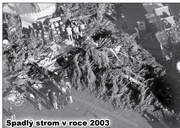
Spadlý strom v roce 2003

phensons z roku 2011 chodí už trvale o holi a ve své stavební firmě se už může věnovat jenom kancelářské práci. Také musel prodat motorku, protože po úrazu už na ní nemohl jezdit. V době po nehodě se mohl pohybovat jen na invalidním vozíku. Několik let trpěl úpornými bolestmi hlavy. Brit nakonec vysoudil odškodné ve výši asi jeden a půl milionu korun.