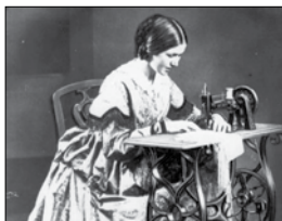
ŠÍTÍ na stroji