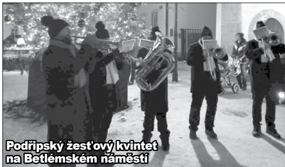
Podřípský žestový kvintet na Betlémském náměstí