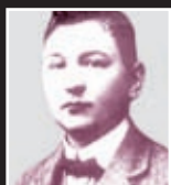
Hašek r. 1911