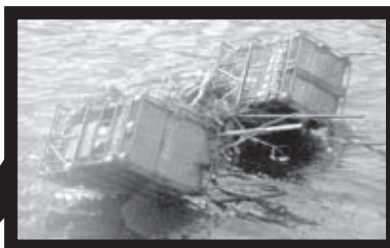
ARTEFAKT z prken, kovu a chroští.