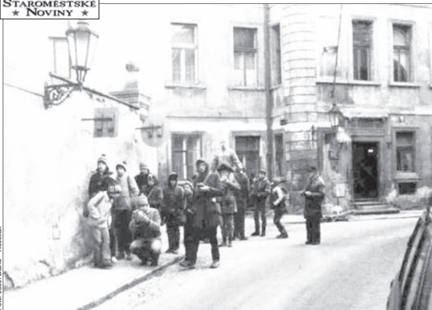
Řešiták

Odhalete, kde byl v Praze 1 pořízen tento snímek a vyhrajte pěkné ceny