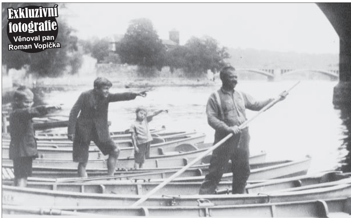
Foto muže, nebyl by Švejk m musím! • Půlnoční drama na Karlově mostě

Exkluzivní fotografie Věnoval pan Roman Vopička