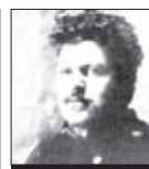
Antonín Slaviček MALÍŘ