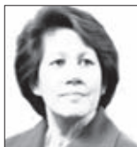
Její výsost Norodom Arunrasmy