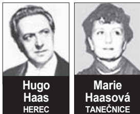
Hugo Haas HEREC